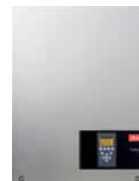
Danfoss TLX+ 6 kW net-inverteren kan både installeres inden-/udendørs.

Der er ingen bevægelige dele i solcelleanlægget, og det eneste vedligeholdelse der påkræves er et årligt tjek, for at se at alt fungerer korrekt.