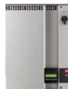
Danfoss ULX 3000i net-inverteren kan både installeres inden-/udendørs.

Der er ingen bevægelige dele i solcelleanlægget, og det eneste vedligeholdelse der påkræves er et årligt tjek, for at se at alt fungerer korrekt.